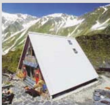
• Scaletta 2205 m