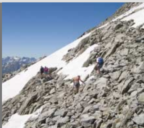
Ad inizio e fine stagione prestare attenzione alla neve sul percorso Anfangs und Ende Saison ist auf der Route den Schneefeldern Aufmerksamkeit zu schenken

Si ringrazia per il contributo: Besten Dank für die Unterstützung: