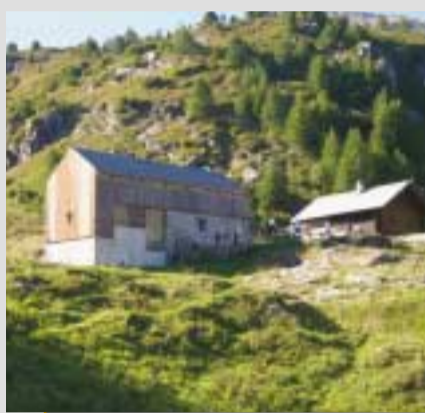
• Boverina 1870 m