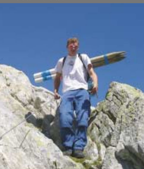
Il tratto dotato di corde fisse Das Teilstück mit fixen Seilen

Bus: Autolinee Bleniesi, tel. 091 862 31 72 Taxi: tel. 091 872 11 24